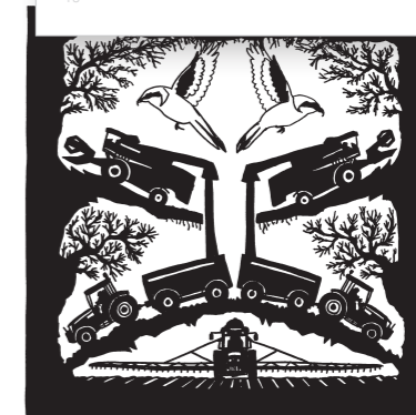
Pie-grièche grise Lanius excubitor

L'intensification de l'agriculture ainsi que la lutte contre les insectes et les rongeurs ont eu raison de cette espèce aux mœurs alimentaires proches des rapaces et qui était encore répandue jusqu'en 1970. Ironie du sort, alors que son nom latin signifie « boucher sentinelle », elle n'a pas eu le temps de sonner l'alarme : sa dernière nidification en Suisse remonte à 1980.