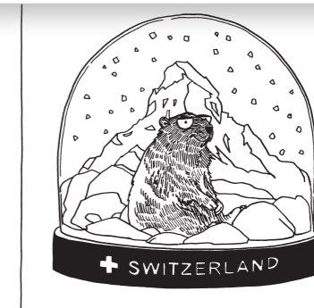
Marmotte des Alpes Marmota marmota

C'est, avec le bouquetin, l'un des symboles des Alpes, voire de la Suisse. Essentiellement présent dans les cantons du sud du pays (Gronne, Tessin, Valais, Uri), le « rat des Alpes » est une espèce adaptée à la vie souterraine. Il hiberne souvent en famille afin de profiter de la chaleur des autres individus.