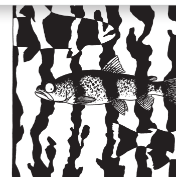
Truite zébrée Salmo rhodanensis

Également appelée « truite du Doubs », car emblématique de la région, ce poisson au motif remarquable est aujourd'hui menacé d'extinction. Il souffre non seulement de la dégradation des eaux de rivière, mais aussi de la perte de son patrimoine génétique : la truite zébrée « hybride » en effet souvent avec la truite atlantique, massivement injectée à des fins de pêche récréative.